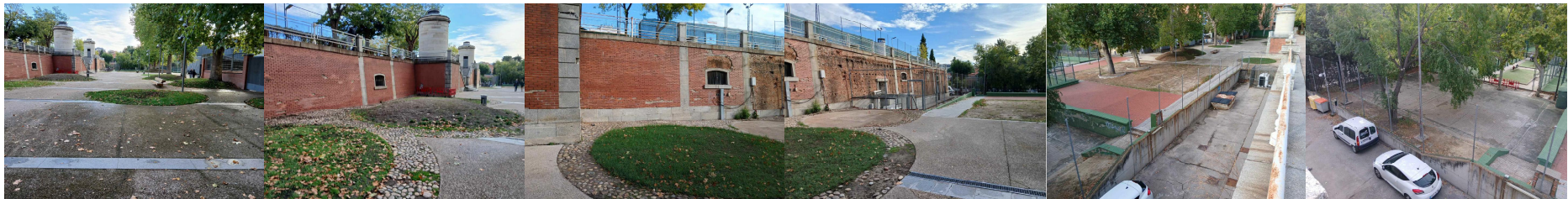
SECCIÓN POR ACCESO DESDE BRAVO MURILLO